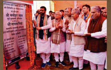
हरियाणा में मुख्यमंत्री नारायण सिंह सैनी के नेतृत्व में विकास कार्य जारी

जिस मनुष्य के अंदर ज्ञान, गुण और शील न हो वह मनुष्य पृथ्वी पर बोझ के समान है।—आचार्य चाणक्य