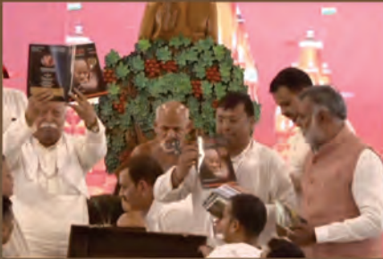
कुंडलपुर में चाणक्य वार्ता के 200वें अंक का विमोचन