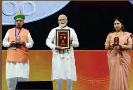
नई दिल्ली में भगवान महावीर 2550वाँ निर्वाण महोत्सव का उद्घाटन