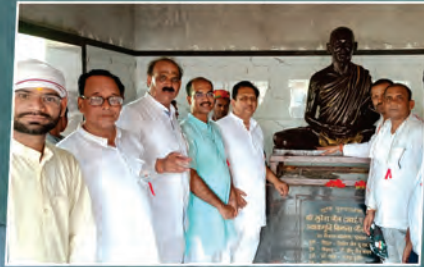
वर्णी जी की जन्मभूमि में स्थापित हुई उनकी अष्टधातु की मूर्ति