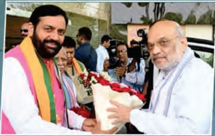
नायब होंगे बीजेपी की ओर से सीएम पद का चेहरा