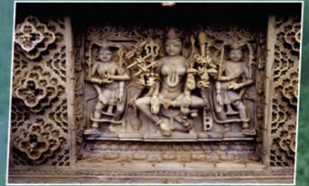
एक नजर जरा इधर भी अद्भुत हैं दिलवाड़ा के जैन मंदिर