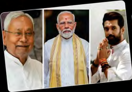
बिहार में एनडीए का धमाल, महागठबंधन धड़ाम

पूरे देश में आतंकी हमले की साजिश नाकाम-बम विस्फोट से दहली दिल्ली, गांव तक पहुंचेगी डिजिटल ज्ञान की नई रोशनी, नूतन समाज धर्म है पंच परिवर्तन अपनाना, श्रमण संस्कृति के उन्नायक थे आचार्य श्री शांति सागर 'छाणी' सहित विभिन्न महत्वपूर्ण लेख एवं सभी स्थायी स्तंभ साथ ही पढ़े देश-विदेश के कोने-कोने की महत्वपूर्ण खबरें।