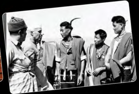
नागालैंड के संस्थापक डॉ. इमकोंगलिबा आओ का व्यक्तित्व और कृतित्व

कोई भी कार्य शुरू करने से पहले स्वयं से सवाल करो कि मैं ऐसा क्यों करने जा रहा हूँ? इसका परिणाम क्या होगा? क्या मैं सफल रहूँगा—आचार्य चाणक्य