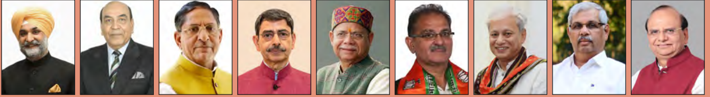
तरनजीत सिंह संधू (दिल्ली), जनरल सैयद अता हसनैन (बिहार), नंद किशोर यादव (नागालैंड), आर.एन. रवि (प.बं.), शिव प्रताप शुक्ला (तेलंगाना) कविंदर गुप्ता (हिमाचल प्रदेश), जिष्णु देव वर्मा (महाराष्ट्र) राजेंद्र विश्वनाथ आलंकर, (तमिलनाडु-अतिरिक्त प्रभार), विनय कुमार सक्सेना (लद्दाख)